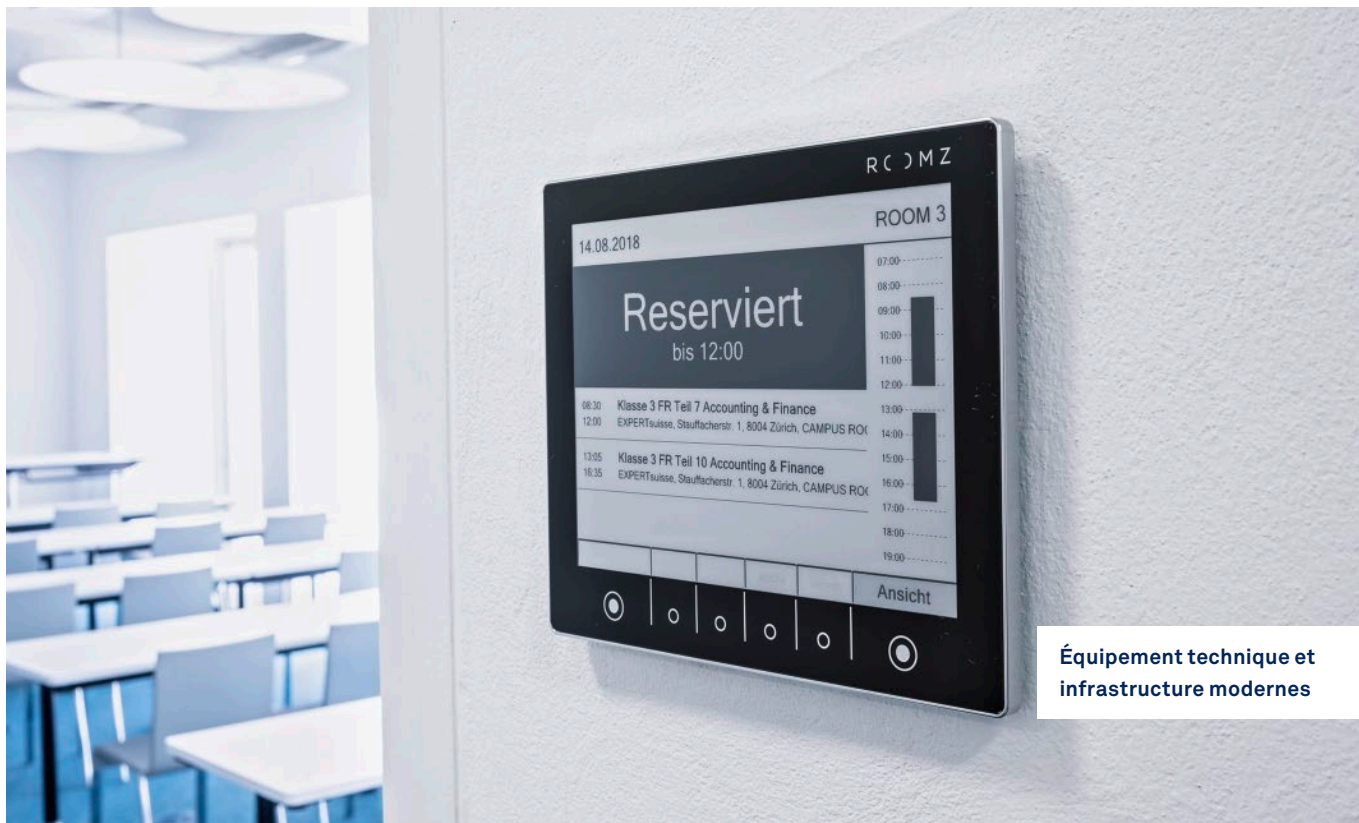
Équipement technique et infrastructure modernes